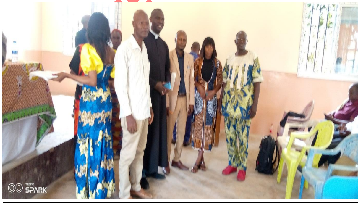
L'équipe de formateurs des EECO

Nous lui souhaitons BON COURAGE. BON VENT